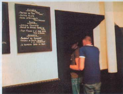
Les convives entrent dans la salle noire guidés par un serveur non voyant.

Se régaler dans l'obscurité totale, c'est l'expérience inédite proposée par un restaurant parisien. Allez-y les yeux fermés